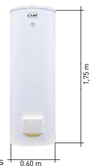
Option ECS ballon 300 litres